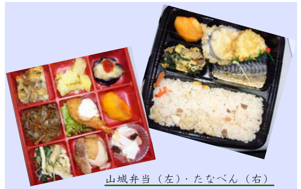
山城弁当(左)・たなべん(右)

今後のことですが、これほどの好評を頂いたことや、今回、購入して頂いた方の中で学生がやっぱり少なかったというのがありますので、もっと地元の物を日常的に学生に食べてもらえる形になればと思います。